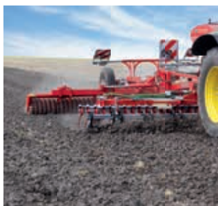
Semis de cultures intercalaires