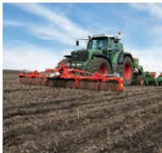
Rouleau GÜTTLER à l'avant pour les semis de maïs