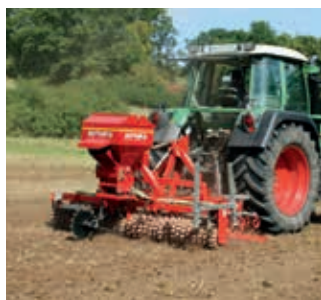
Ensemencement des prairies sans labour