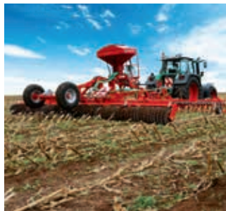
Combat la pyrale du maïs